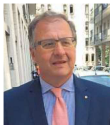
QUIRINO BARONE CASCINA MALFATTA RONSECCO

Il settore ha retto bene anche se l'alluvione di ottobre ha condizionato alcune varietà