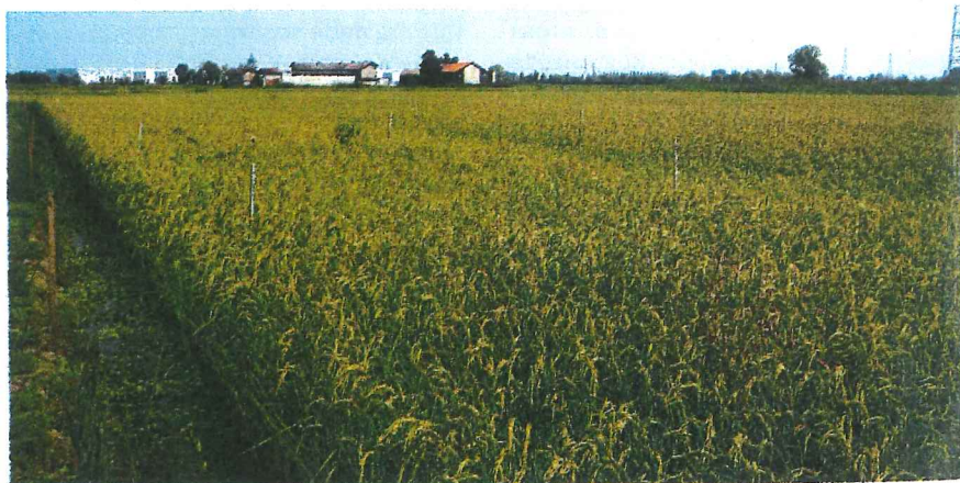
Foto 1 Nelle acque di irrigazione, sono state riscontrate alcune sostanze maggiormente utilizzate nella difesa della coltura quali MCPA, clomazone, imazamox, glifosate con AMPA e azoxystrobin

Clomazone è stato rilevato nei tre anni di studio soltanto a una certa distanza di tempo rispetto al comune periodo di utilizzo; nel 2019, ad esempio, si è osservato un picco di 1,51 µg/L il 14 agosto.