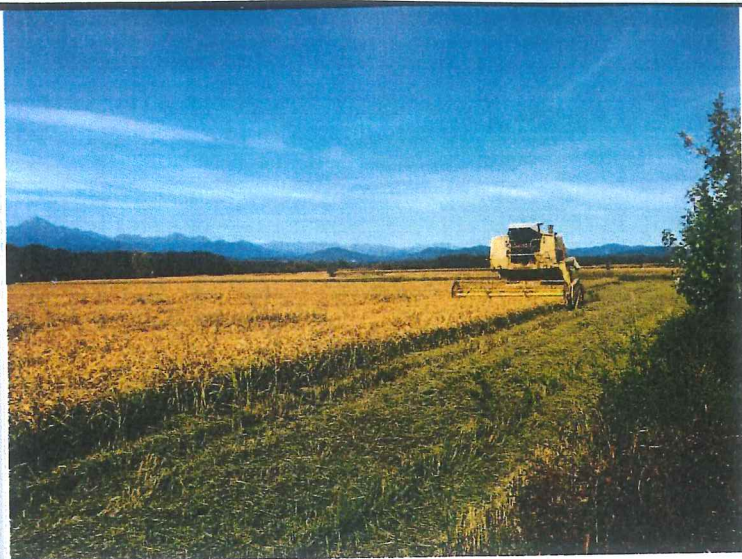
Foto 2 Sulla base dei risultati è ragionevole ritenere che le attuali condizioni di uso promiscuo delle acque di irrigazione tra risicoltura biologica e convenzionale non diano luogo a particolari rischi di contaminazione da residui di prodotti fitosanitari nel riso destinato al consumo