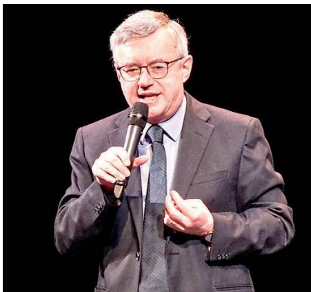
Alessandro Barbero terrà una conferenza in settembre per Risò