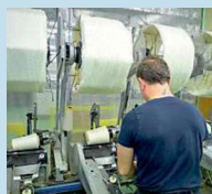
L'azienda Zegna Baruffa

Poste celebra Zegna Baruffa e il Made in Italy