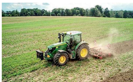
Il costo dei fertilizzanti e del gasolio agricolo è alle stelle

azotati o organici. Ma quelli azotati sono alla base della risicoltura e non solo, ad esempio per la produzione di mais». A questo si aggiungono gli aumenti del gasolio agricolo, passato da circa 0,85 euro al litro fino a 1,38 euro/litro. «Mi immagino - prosegue il presidente di Coldiretti Vercelli e Biella - che rincari interessanti o interessanti anche i fitofarmaci. Ciò che ci preoccupa maggiormente in questo momento sono questi