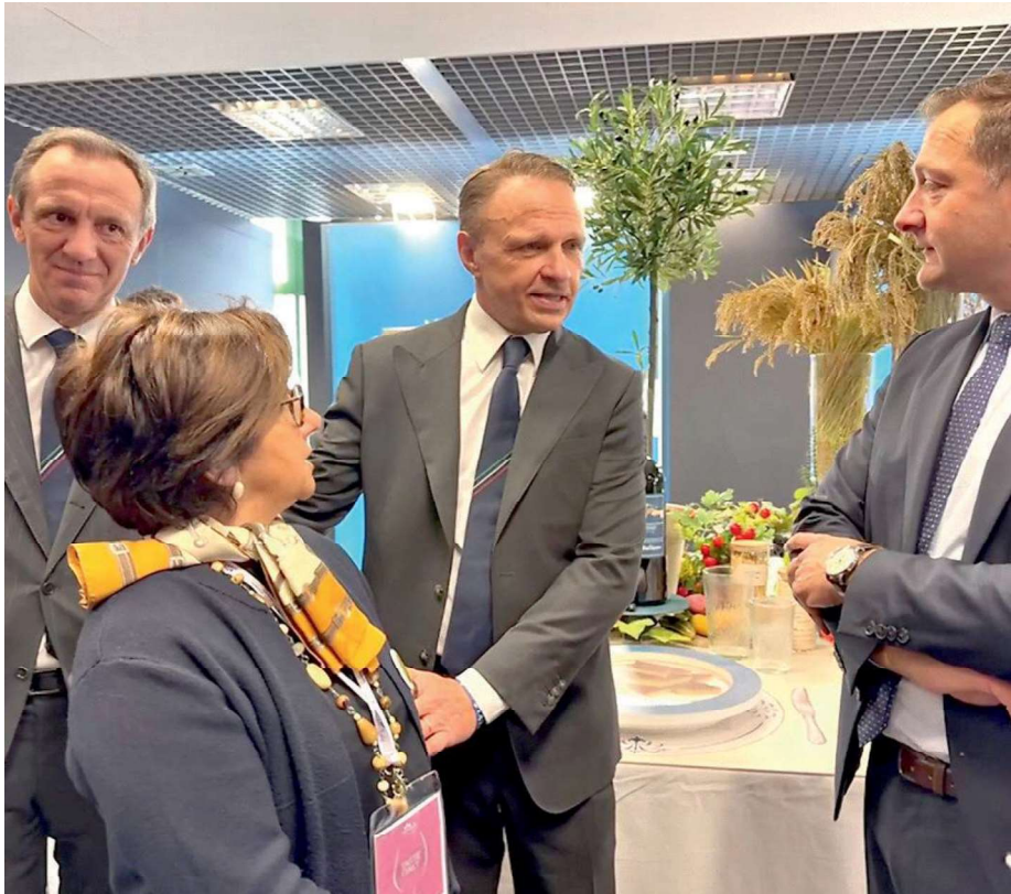
La presidente di Ente Risi, Natalia Bobba, con il ministro dell'Agricoltura, Francesco Lollobrigida

Ancora oggi, ultimo giorno della kermesse veronese, le risaie vercellesi hanno un posto d'onore nello stand del Ministero dell'Agricoltura allestito al Palaexpo. In più è stato riallestito il tavolo interattivo di Ente Nazionale Risi dedicato al chicco «re» nel contesto della cucina italiana, riconosciuta patrimonio Unesco: un tavolo didattico con 12 grandi piatti illustrati che raccontano l'Italia del riso attraverso immagini suggestive, arricchito per l'occasione