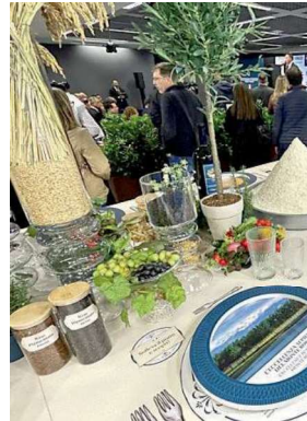
Un momento di promozione del riso