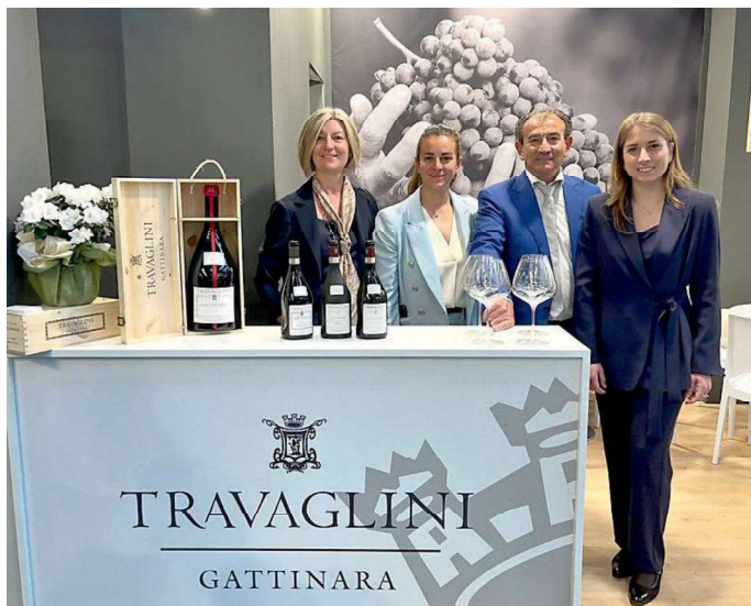
Lo stand della cantina Travaglini presente come sempre alla rassegna di Verona