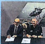
Acca e Fad di Md, Weeks

Mecaer aggiorna le strumentazioni di Md helicopters