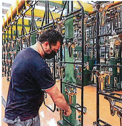
Quello delle rubinetterie è un settore trainante nel Novarese