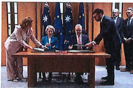
Le firme di Von der Leyene e del premier australiano Albanese.

tati - attacca la presidente Natalia Bobba - il quantitativo di cui stiamo parlando è un neo rispetto a quanto entra ora nell'Ue senza pagare il dazio, ma questa ulteriore concessione mette in evidenza ancora una volta quanta poca attenzione ci sia da parte dell'Ue verso i problemi del riso e in particolare di quello italiano». Ente risi solleva anche un giallo sul patto intercontinentale. «Consultando il sito del governo australiano - se-