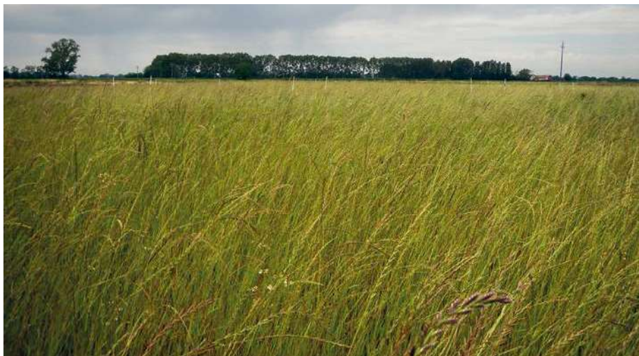
Lolium multiflorum (loiessa)

L'andamento dei valori di P-NaOH ha mostrato un deciso decremento nel cor-