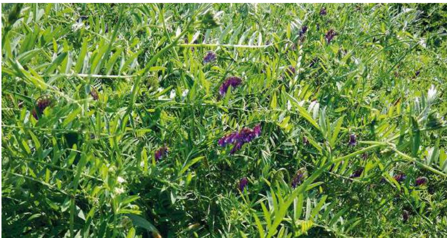
Vicia villosa (veccia vellutata)

La veccia, oltre ad aver prodotto una maggiore biomassa, ha mostrato una dotazione di nutrienti ben superiore alla loiessa, confermandosi come l'essenza più vocata per la pratica del sovescio nel panorama risicolo italiano.