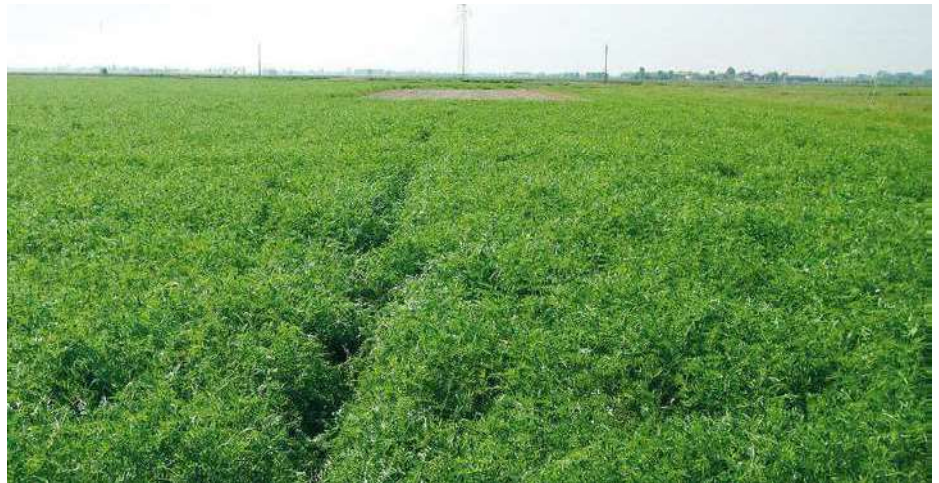
Campo sperimentale con veccia

L'effetto delle cover crop sul riso in successione è generalmente benefico, ma nella sperimentazione in questione la loiessa ha causato l'immobilizzazione del fosforo nel suolo, con conseguente diminuzione dell'assorbimento, mentre con il sovescio di veccia l'apporto di questo elemento è risultato maggiormente disponibile