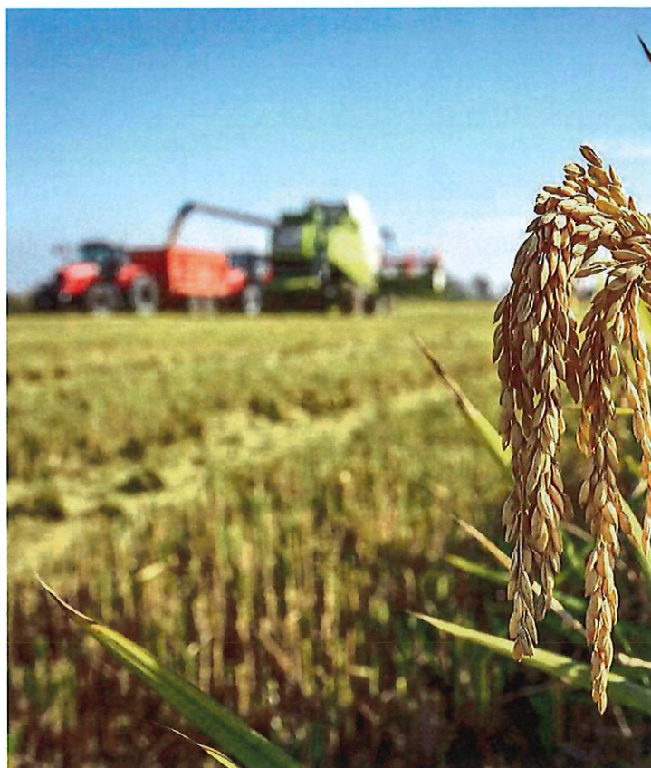
Campi di riso arrivati a maturazione nel Novarese in una foto d'archivio