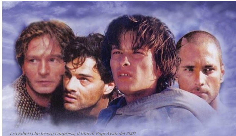
I cavalieri che fecero l'impresa, il film di Pupi Avati del 2001

Ecco chi sono gli eurodeputati che si sono schierati in difesa del riso. Ora però c'è il nodo EBA